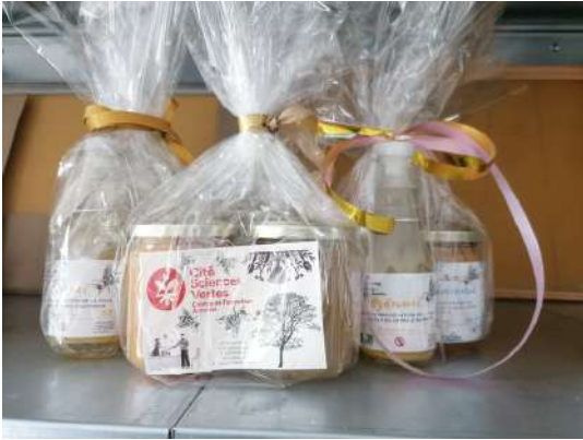
JPO 23 MARS et présentation de l'atelier apicole- Auterive