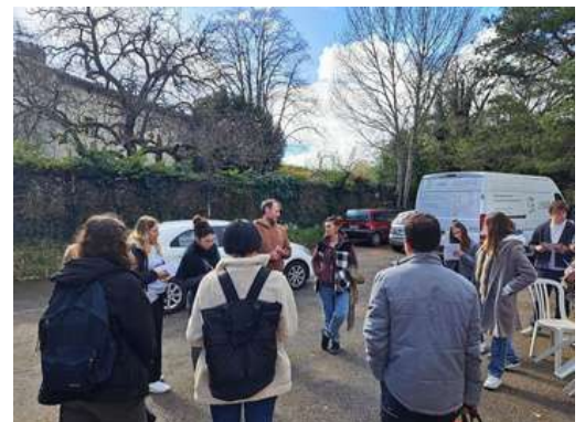
Visite de l'association la Rafistolerie avec les Terminales STAU Services