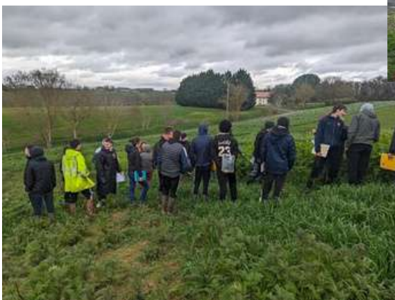
Journée observation et prélèvements d'expérimentation couverts végétaux en partenariat avec LIA et techniciens val de Gascogne pour les étudiants du BTS ACSE I