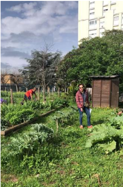
BPI AP - Visite Potager sur les toits