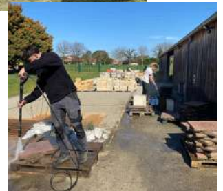
BPI AP - Chantier rénovation batiment I3