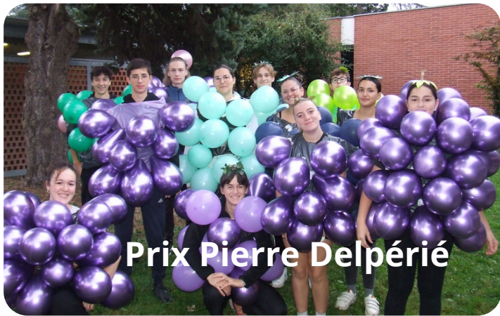
Prix Pierre Delpérié

retour sur la Journée SPORT Retrouvez toutes les photos: en cliquant ici ou en scannant le qr code