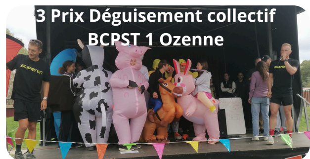
3 Prix Déguisement collectif BCPST 1 Ozenne