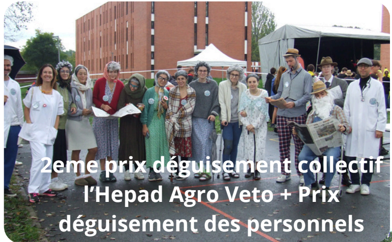
2eme prix déguisement collectif l'Hepad Agro Veto + Prix déguisement des personnels