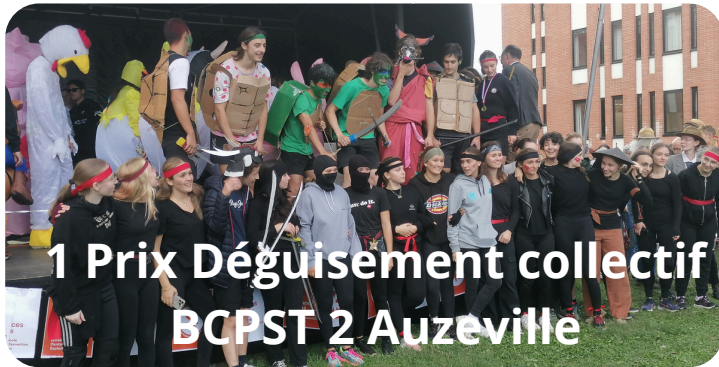
1 Prix Déguisement collectif BCPST 2 Auzeville