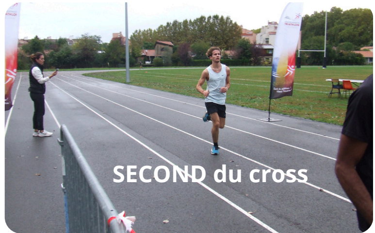
SECOND du cross